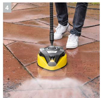
4 Встроенное промывочное сопло