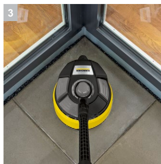
3 Встроенное мощное сопло